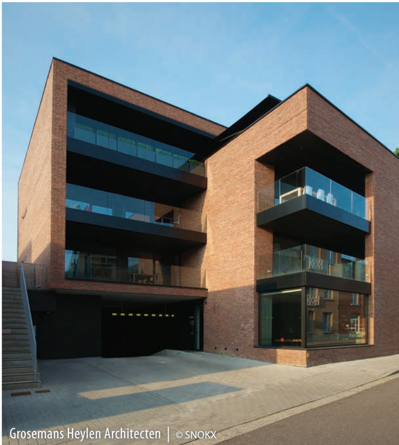
Grosemans Heylen Architecten