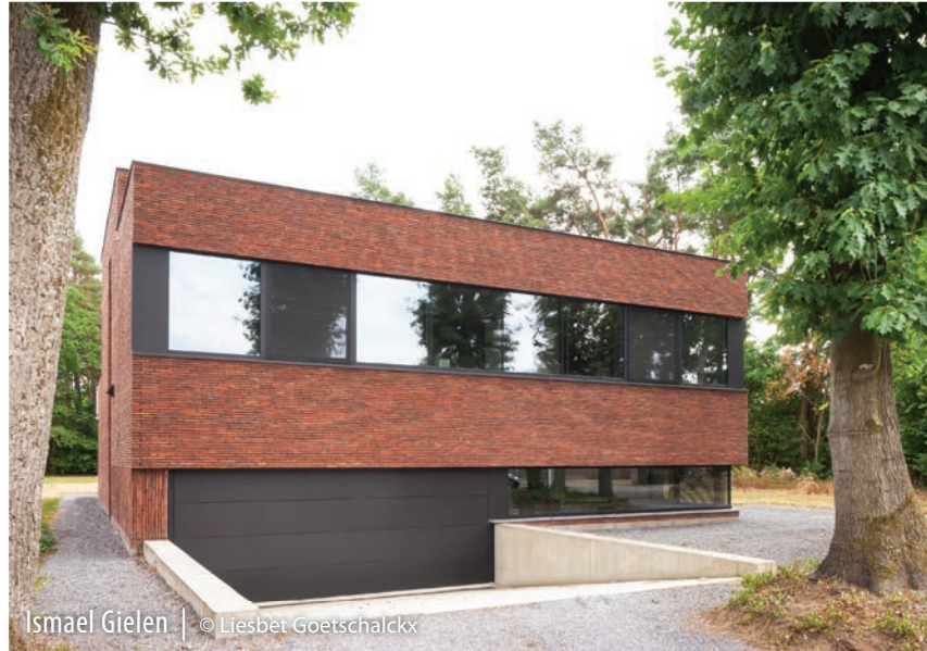
Ismael Gielen | © Liesbet Goetschalckx