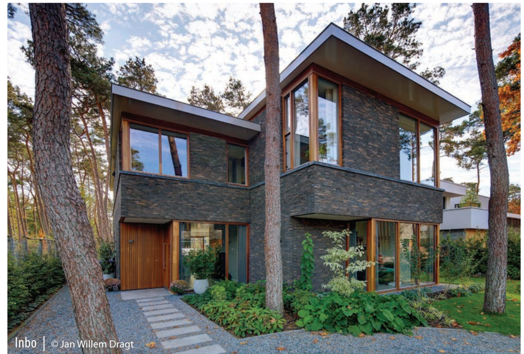
Inbo | © Jan Willem Dragt