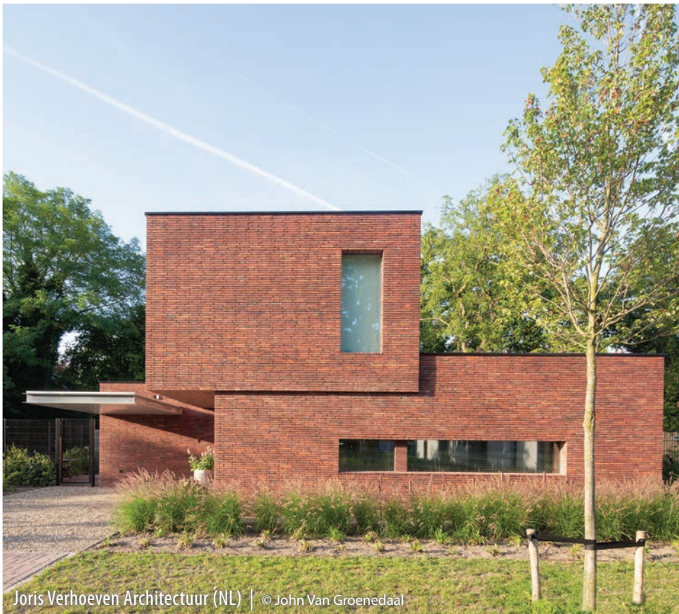
Joris Verhoeven Architectuur (NL)