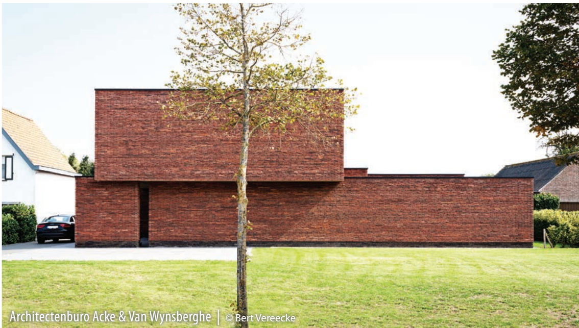
Architectenburo Acke & Van Wynsberghe