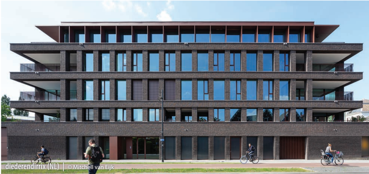
diederendirrix (NL)