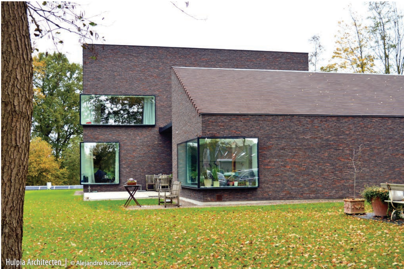
Hulpia Architecten | © Alejandro Rodriguez