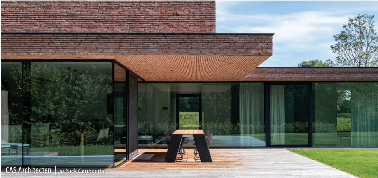
CAS Architecten