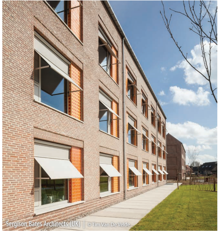
Sergison Bates Architects (UK)