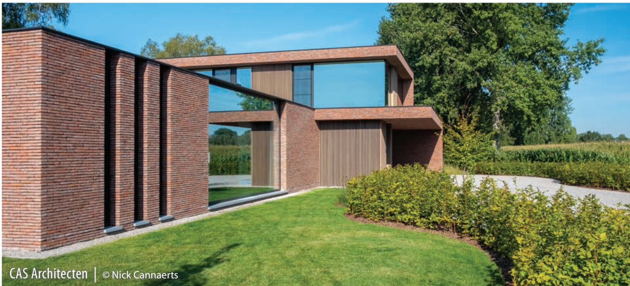
CAS Architecten | © Nick Canaerts