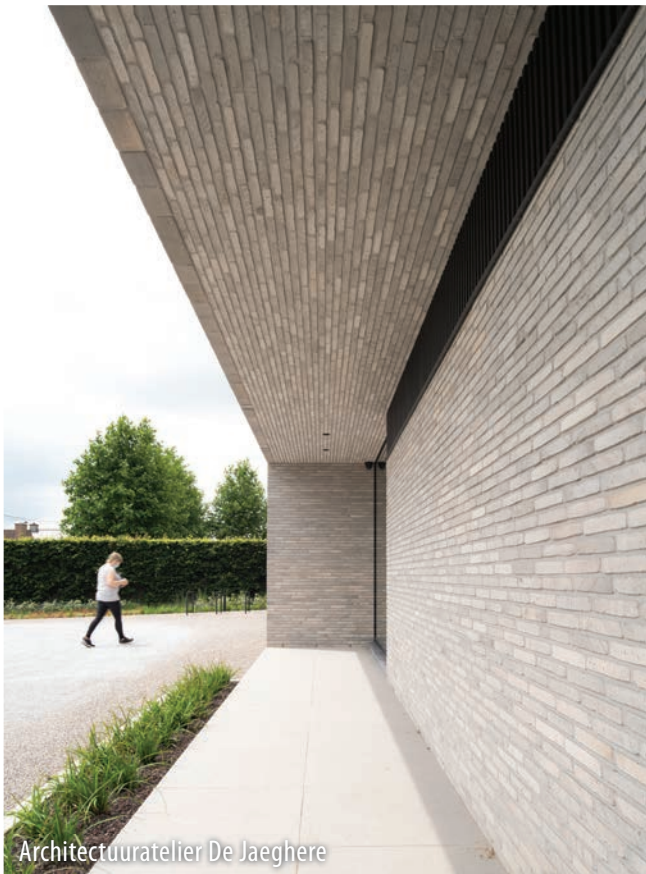
Architectuuratelier De Jaeghere