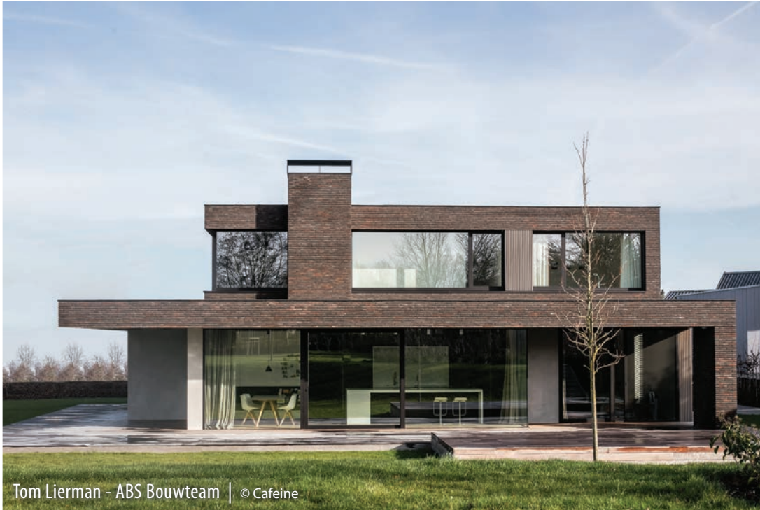
Tom Lierman - ABS Bouwteam