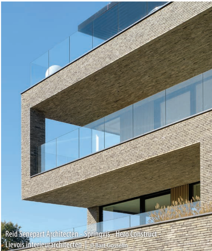
Reid Senepart Architecten - Springvis - Hero Construct Lievois interieurarchitecten | © Bart Gosselin