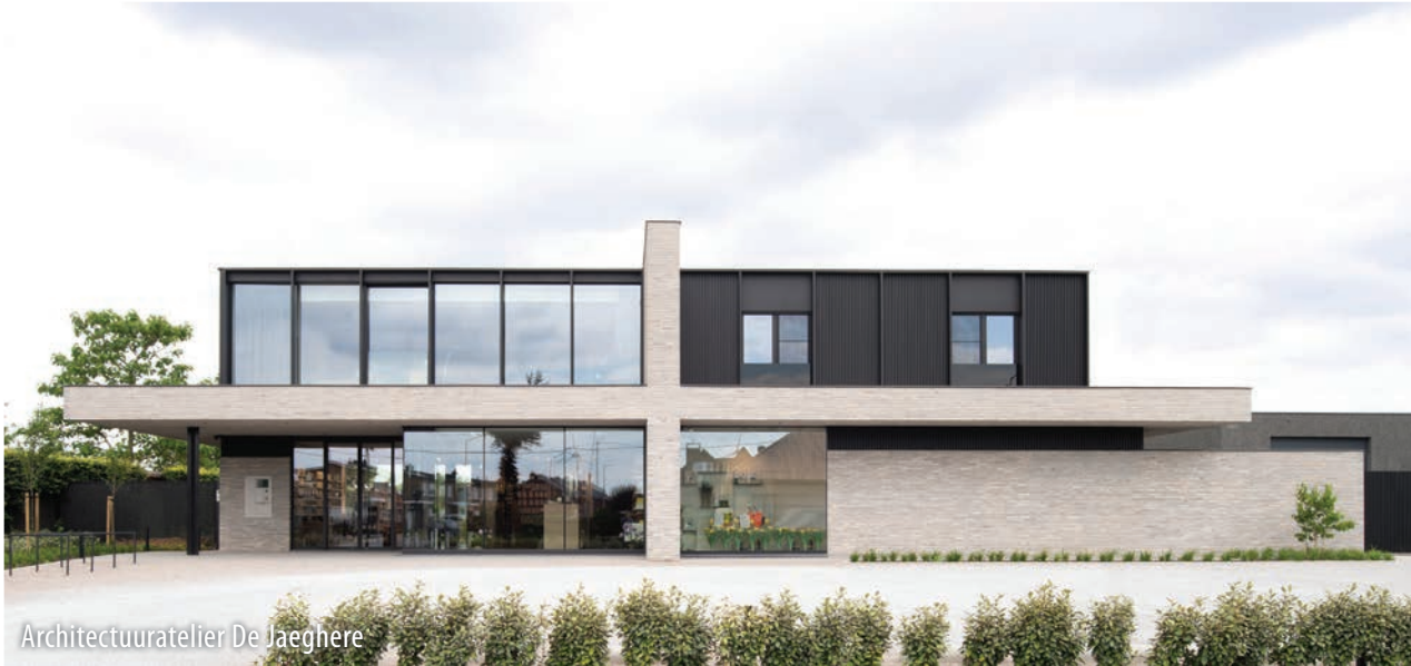
Architectuuratelier De Jaeghere