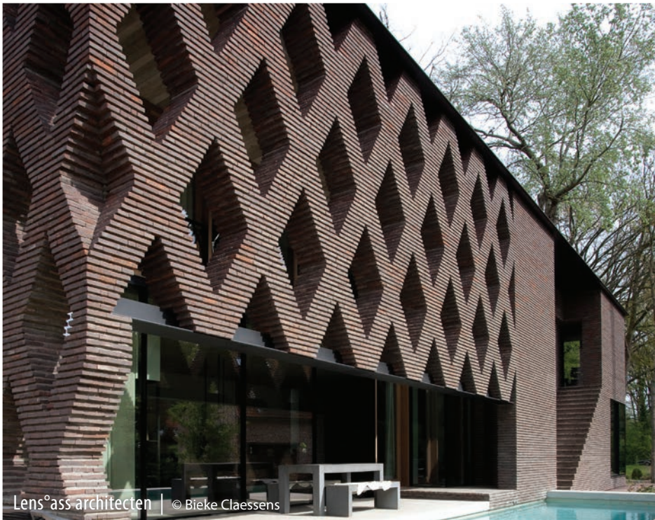
Lens°ass architecten | © Bieke Claessens