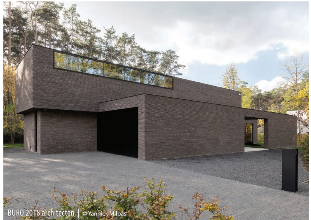
BURO 2018 architecten | © Yannick Milpas