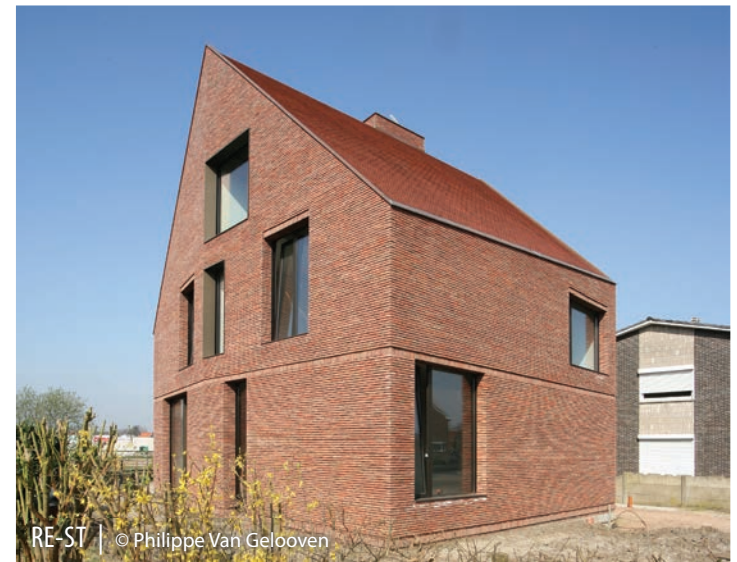
RE-ST | © Philippe Van Gelooven