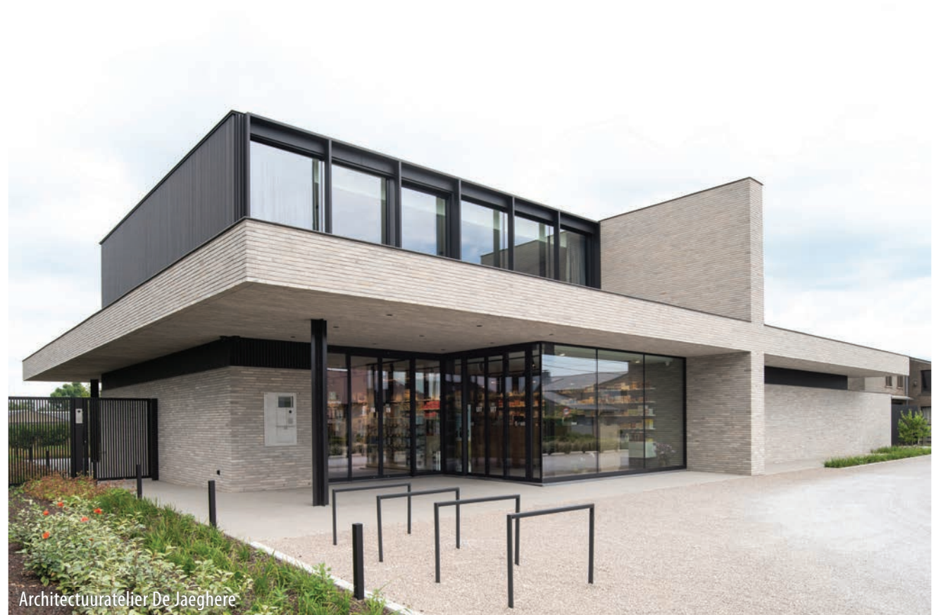
Architectuuratelier De Jaeghere