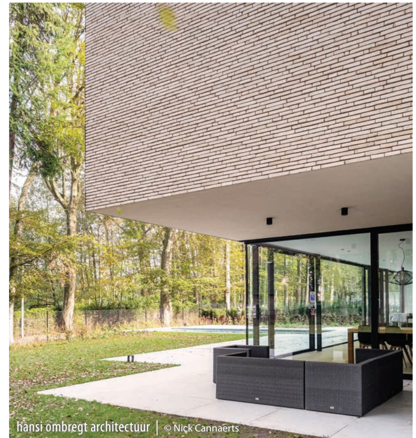
hansi ombregt architectuur