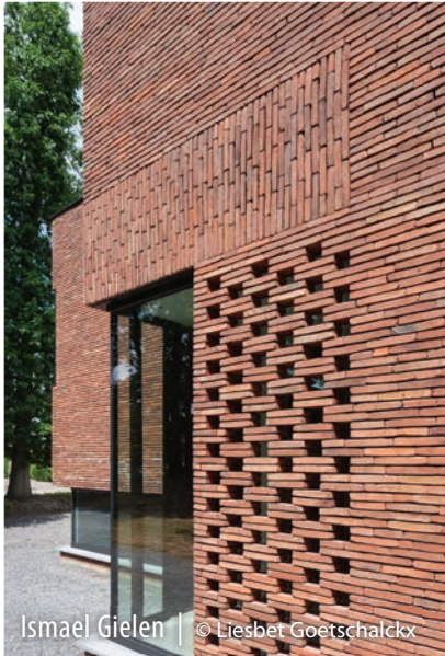
Ismael Gielen