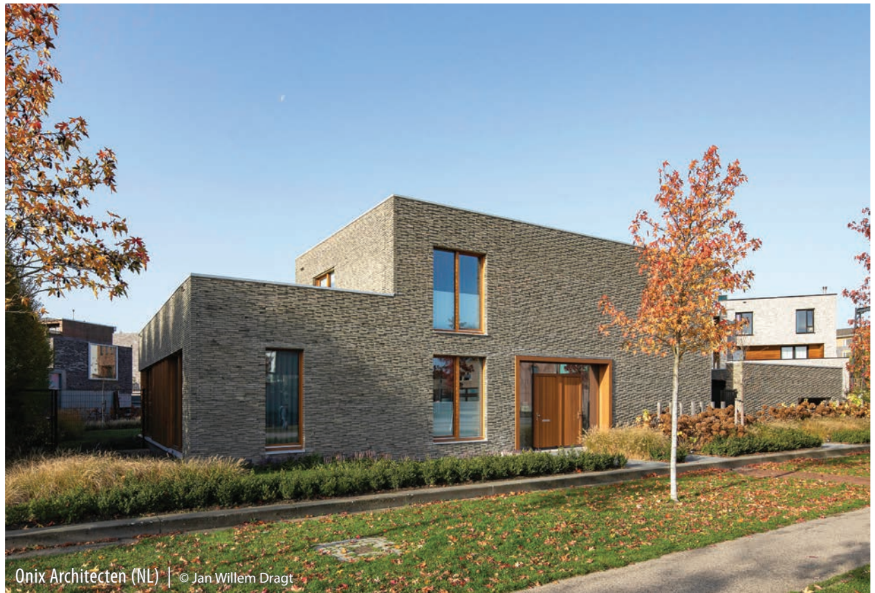
Onix Architecten (NL)