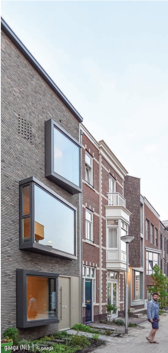
gaaga (NL) | © gaaga