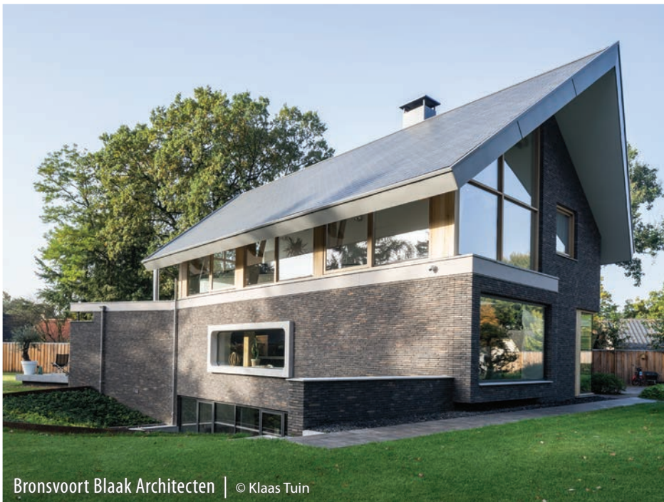
Bronsvort Blaak Architecten | © Klaas Tuin