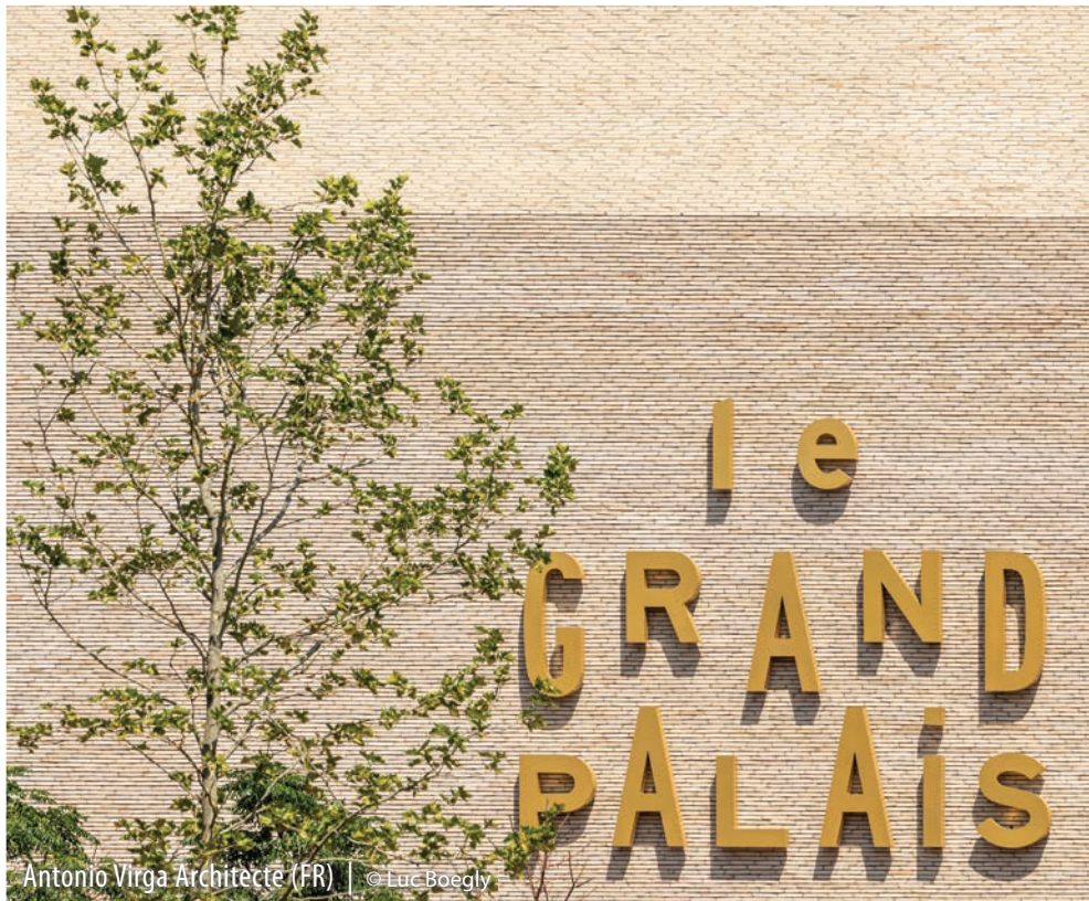
Antonio Virga Architecte (FR)