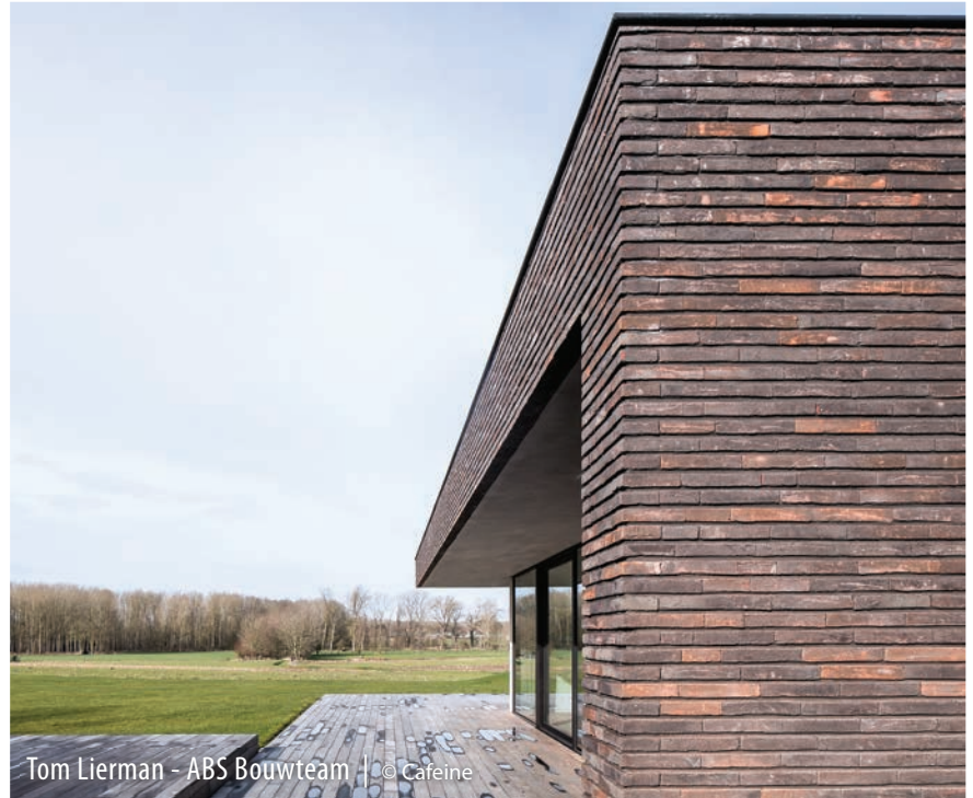
Tom Lierman - ABS Bouwteam