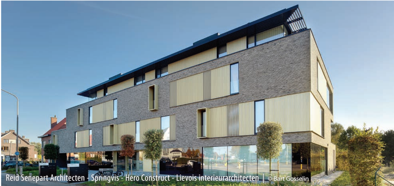
Reid Senepart Architecten - Springvis - Hero Construct - Lievois interieurarchitecten