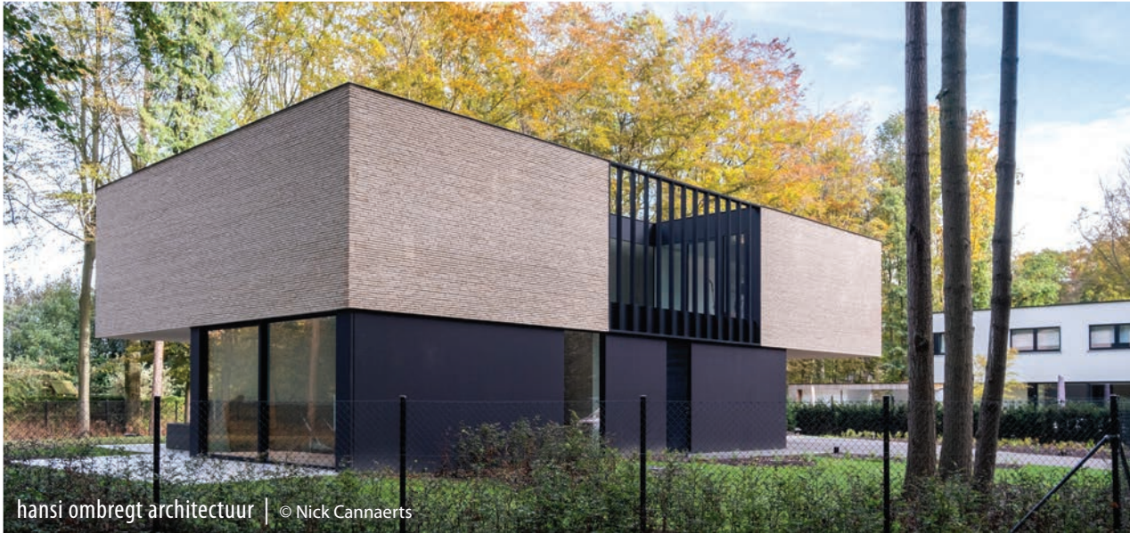
hansi ombregt architectuur | © Nick Cannaerts