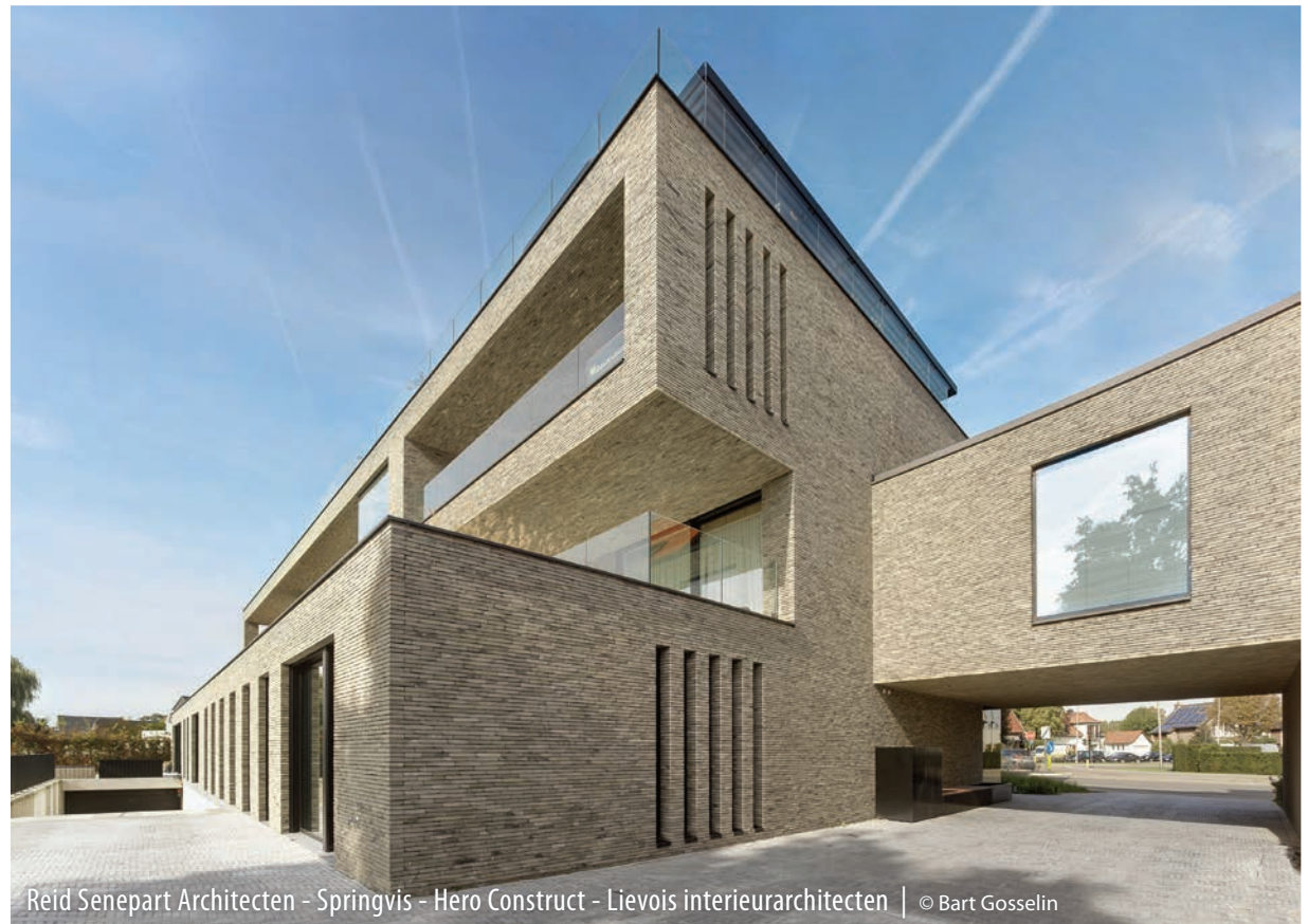
Reid Senepart Architecten - Springvis - Hero Construct - Lievois interieurarchitecten