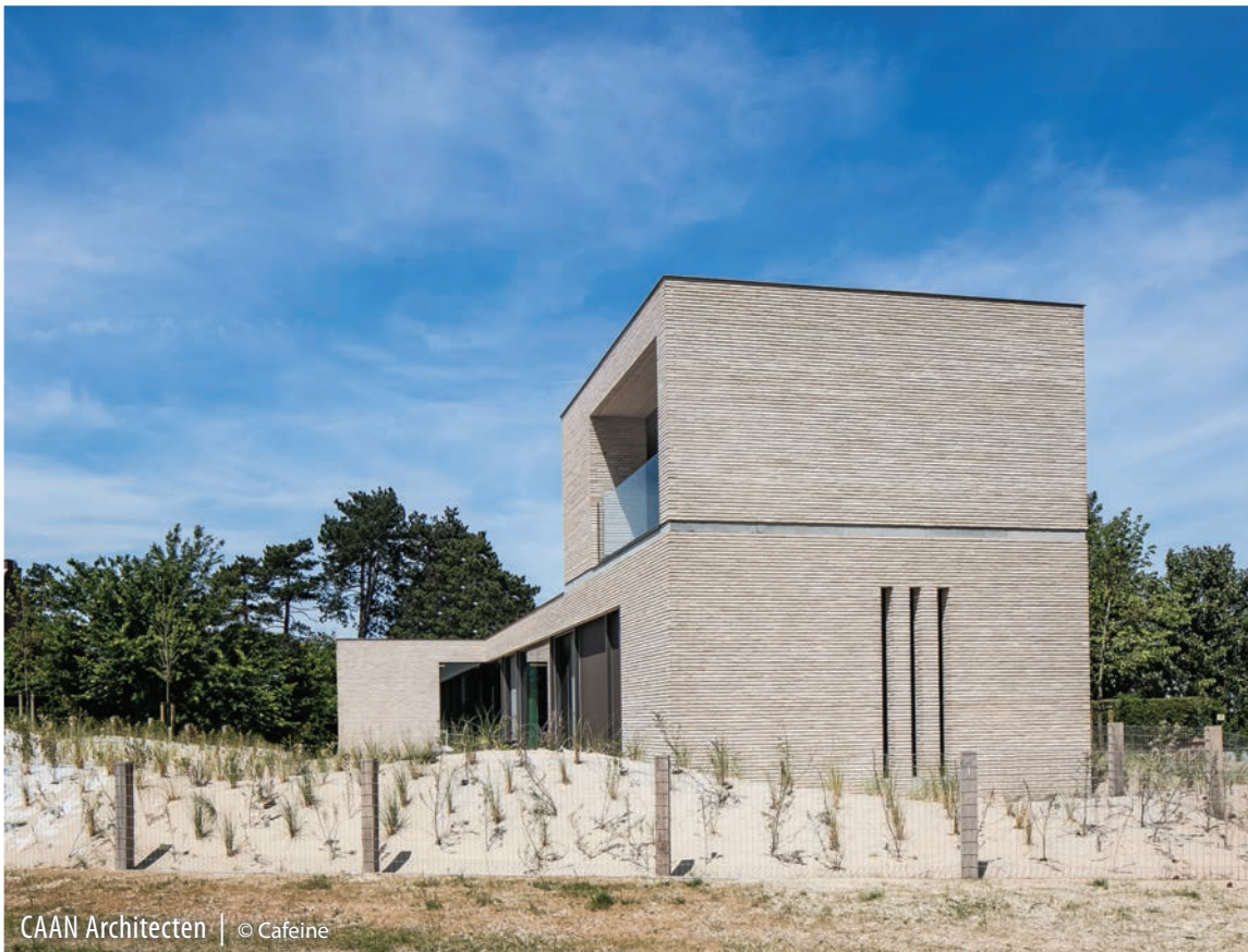
CAAN Architecten