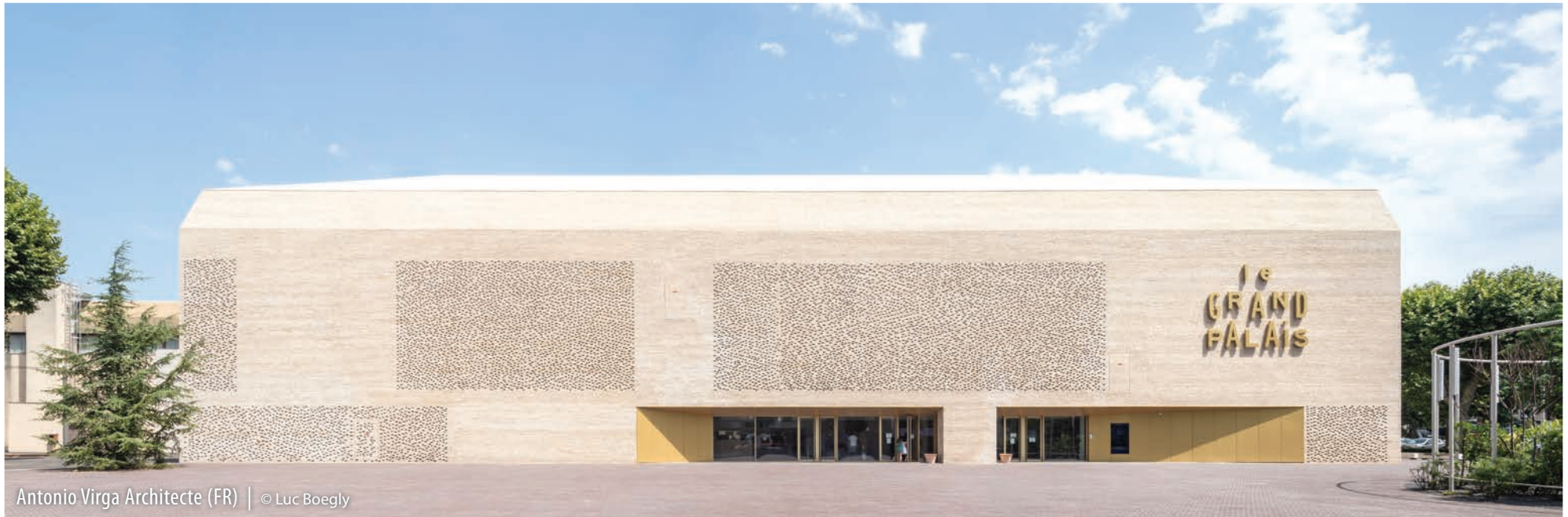
Antonio Virga Architecte (FR)