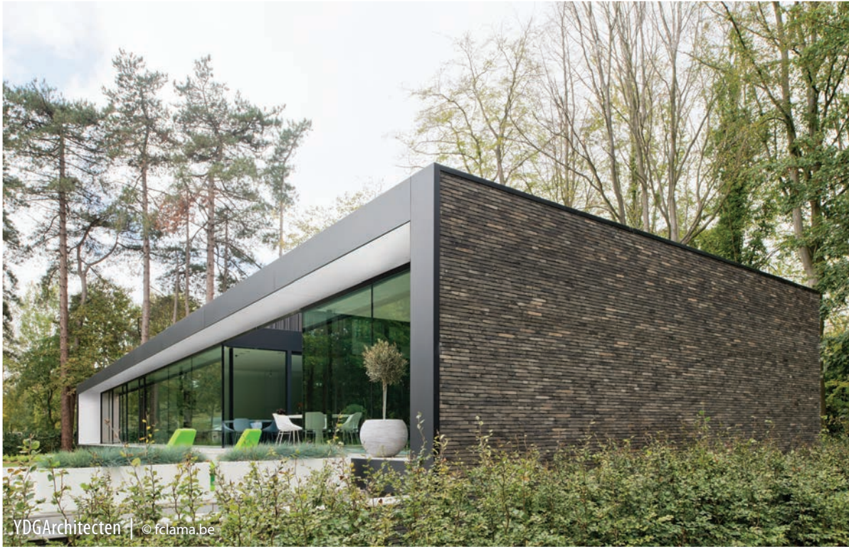
YDGArchitecten | © fclama.be