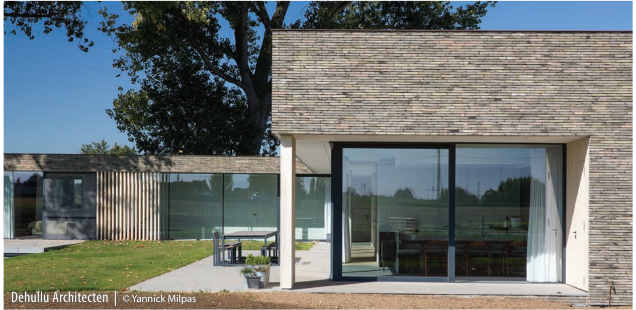
Dehullu Architecten